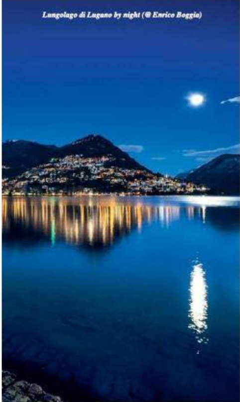
Lungolago di Lugano by night

Durerà fino a metà giugno la tredicesima edizione di S. Pellegrino Saperi Ticino , il festival enogastronomico che ogni anno porta in Ticino grandi personalità della cucina internazionale, ospitate dagli chef locali in splendide strutture alberghiere e ristoranti di alta gastronomia. Un appuntamento che negli anni è diventato uno degli eventi più amati e attesi dai gourmet. Questa golosa kermesse potrebbe essere uno dei tanti motivi per visitare il più soleggiato e solare cantone della Svizzera, che a livello turistico ha moltissimo da offrire. Se la regione di Ascona-Locarno offre grandi opportunità di svago e relax all'insegna di scorci spettacolari sul Lago Maggiore e vallate verdeggianti uniche, Lugano e le zone circostanti propongono panorami mozzafiato sul Lago Ceresio e un'offerta di attività sportive e outdoor notevole. Non è da meno la regione del Mendrisiotto, dove tra vigne e vette verdeggianti si può vivere un'esperienza tra natura e paleontologia. Arte, cultura, natura e sport: ma per vivere davvero il Ticino bisogna andare alla scoperta dell'enogastronomia locale, tra cantine, grotti e ristoranti.