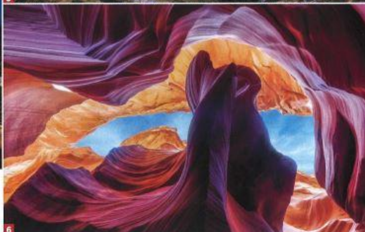
1. Lo Zhangye Danxia Landform Geological Park in Cina; 2. Tenuta Capofaro, Isola di Salina; 3. Four Season private Island, Voavah (Maldive). 4. Experience hotel Su Gologone a Oliena (Nu); 5. Il Fiore di Pietra sul Monte Generoso, Castel San Pietro, Svizzera; 6. Antelope Canyon in Arizona.

cuore della World Biosphere Reserve dell'Unesco, Voavah consente di vivere una vacanza senza eguali, lontano dal mondo, in un vero proprio paradiso terrestre, coccolati dall'iconico servizio Four Seasons. Voavah comprende 7 suite, una Spa all'avanguardia, un centro immersioni e una Beach house dotata di un salotto open air, sala da pranzo, cucina, pool deck, palestra, libreria e lounge, il punto d'incontro delle suite.